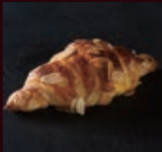
アーモンドクロワッサン