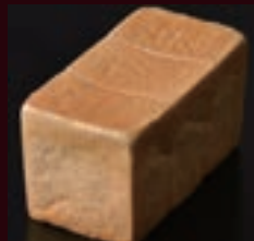
[サイズ:1.5斤] キャッスルブレッド